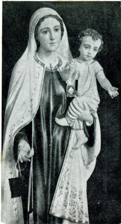
NUESTRA SEÑORA DEL CARMEN DE FÁTIMA