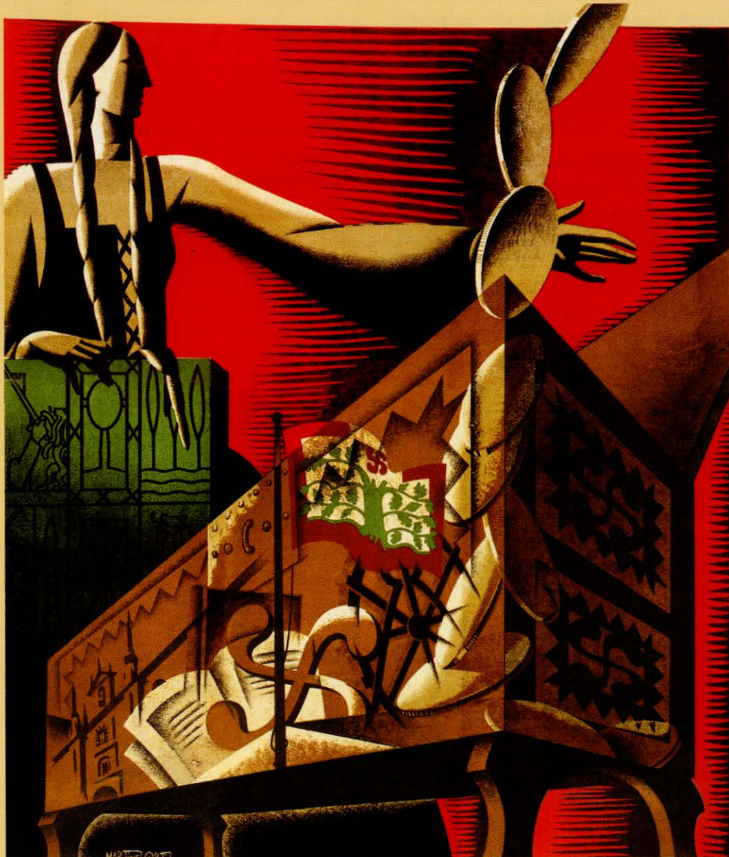
Aberri-Aldeko Eguneko Irabazija - 1935 Azilla 30 eta Lotazilla 1'ean

EUSKAL NAZIONALISMOAREN HISTORIAKO EHUN URTE